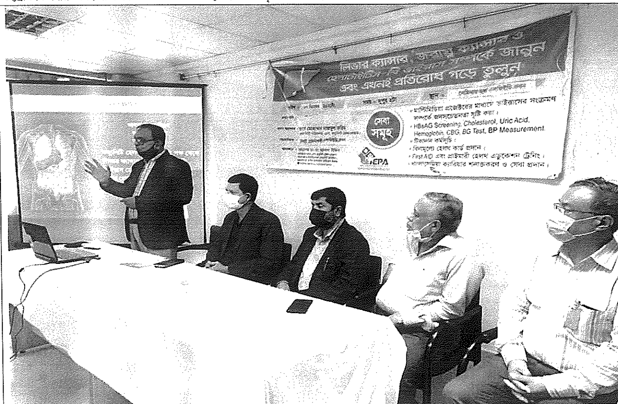
চট্টগ্রাম বিভাগীয় অফিসের কর্মকর্তা ও কর্মচারীর স্বাস্থ্য সচেতনতা বৃদ্ধির লক্ষ্যে হেপাটাইটিস-বি সংক্রান্ত কর্মশালা ও টিকা প্রদান কার্যক্রম আয়োজন