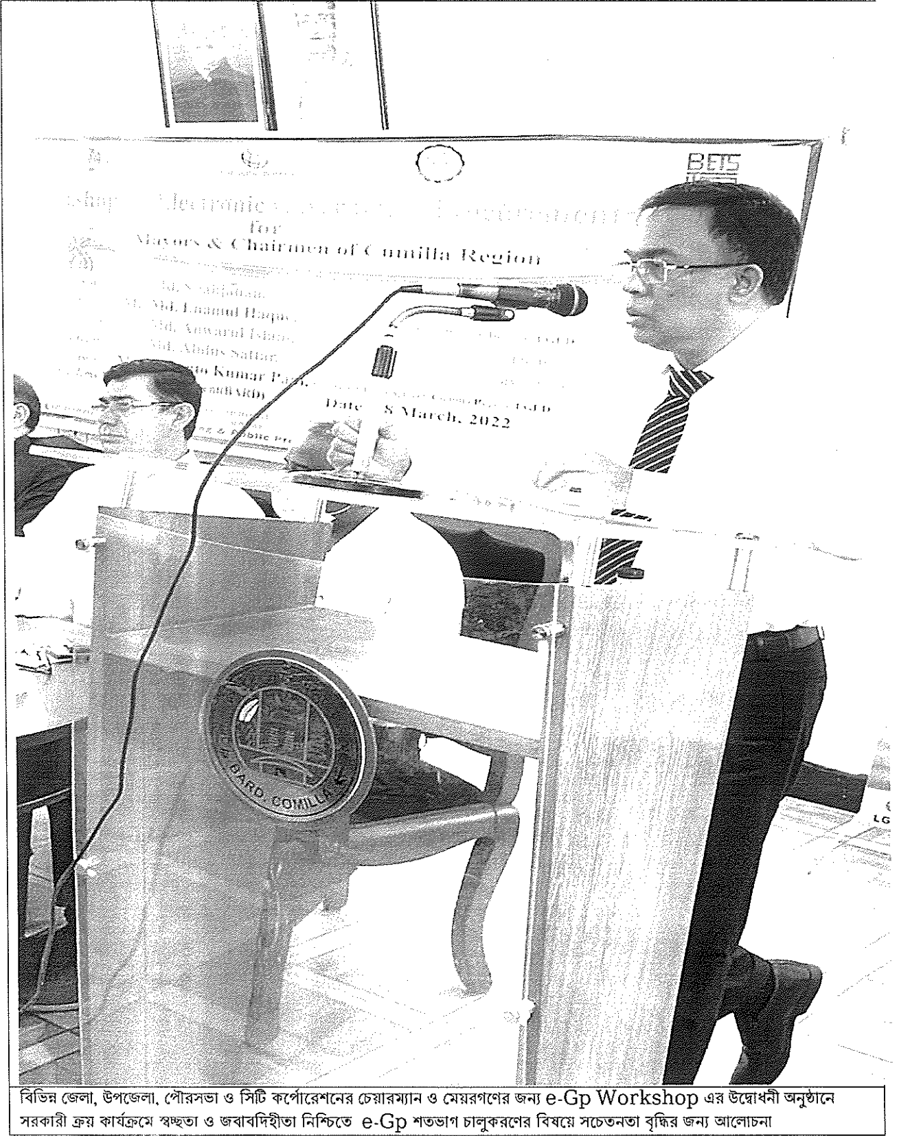
বিভিন্ন জেলা, উপজেলা, পৌরসভা ও সিটি কর্পোরেশনের চেয়ারম্যান ও মেয়রগণের জন্য e-Gp Workshop এর উদ্বোধনী অনুষ্ঠানে সরকারী ক্রয় কার্যক্রমে স্বচ্ছতা ও জবাবদিহীতা নিশ্চিত্তে e-Gp শতভাগ চালুকরণের বিষয়ে সচেতনতা বৃদ্ধির জন্য আলোচনা