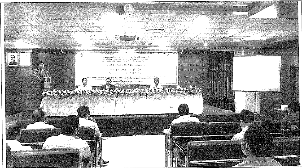
(১.৪- শুদ্ধাচার সংক্রান্ত প্রশিক্ষণ) Awareness Training on Climate Science, CRIMP & CReLIC