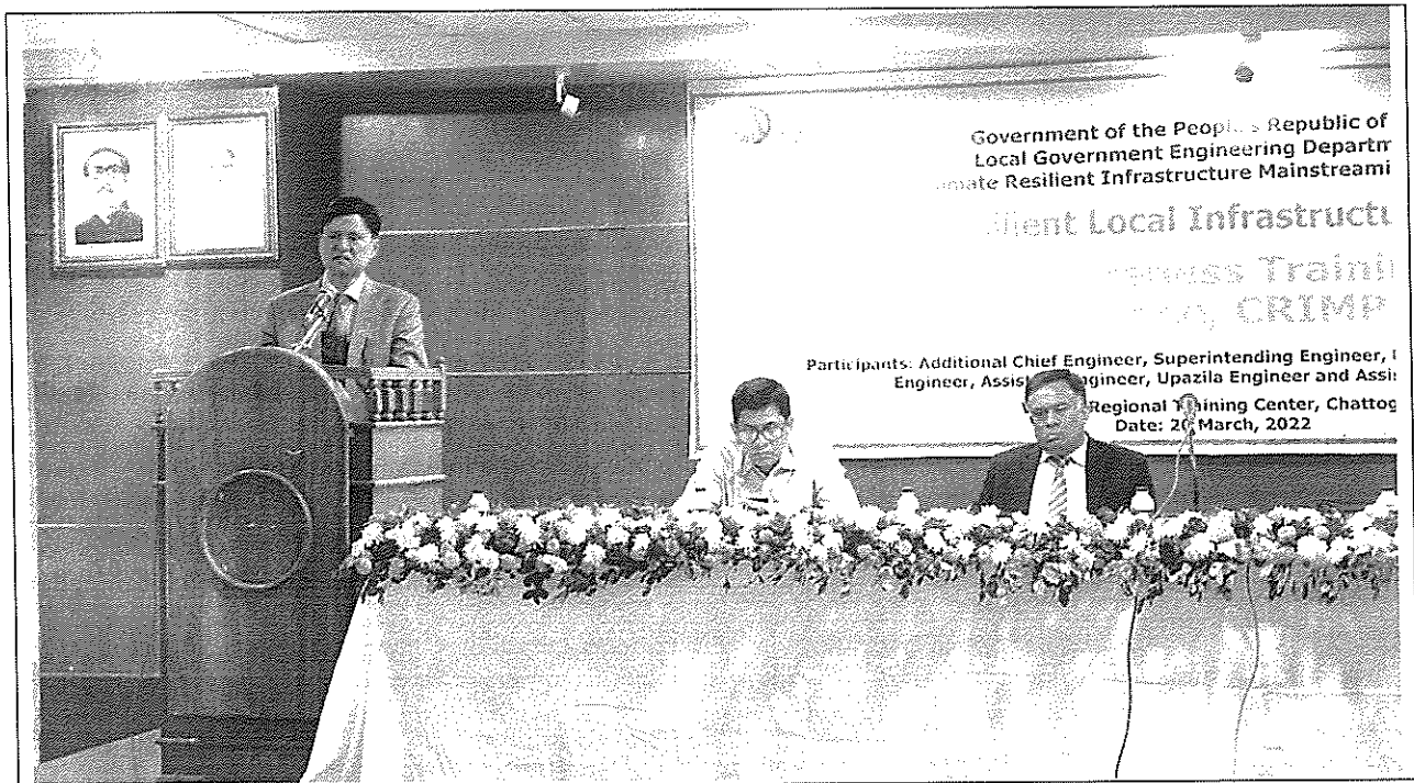
(১.৪- শুদ্ধাচার সংক্রান্ত প্রশিক্ষণ) Awareness Training on Climate Science, CRIMP & CReLIC