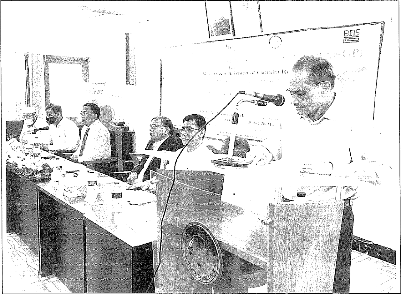
বিভিন্ন জেলা, উপজেলা, পৌরসভা ও সিটি কর্পোরেশনের চেয়ারম্যান ও মেয়রগণের জন্য e-Gp Workshop এর উদ্বোধনী অনুষ্ঠানে সরকারী ক্রয় কার্যক্রমে স্বচ্ছতা ও জবাবদিহিতা নিশ্চিত করে e-Gp শতভাগ চালুকরণের বিষয়ে সচেতনতা বৃদ্ধির জন্য আলোচনা