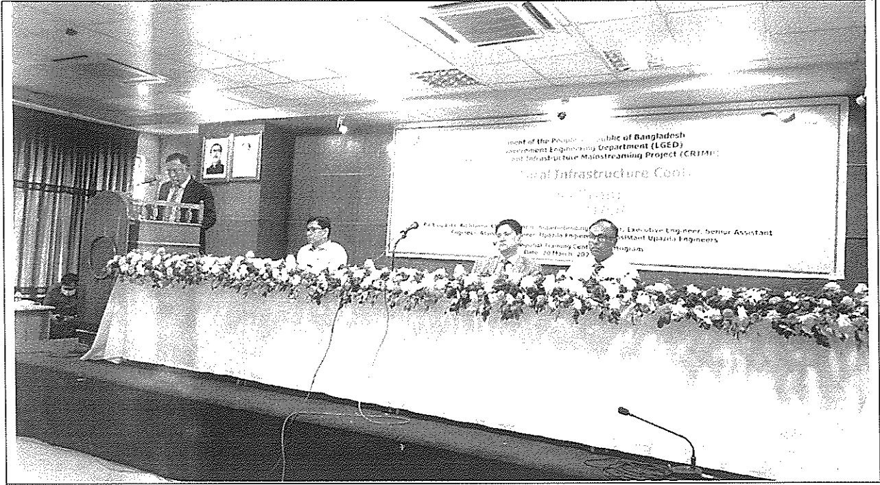
(১.৪- শুদ্ধাচার সংক্রান্ত প্রশিক্ষণ) Awareness Training on Climate Science, CRIMP & CReLIC