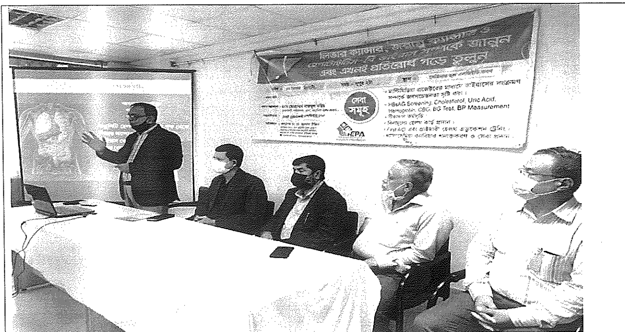
চট্টগ্রাম বিভাগীয় অফিসের কর্মকর্তা ও কর্মচারীর স্বাস্থ্য সচেতনতা বৃদ্ধির লক্ষ্যে হেপাটাইটিস-বি সংক্রান্ত কর্মশালা ও টিকা প্রদান কার্যক্রম আয়োজন