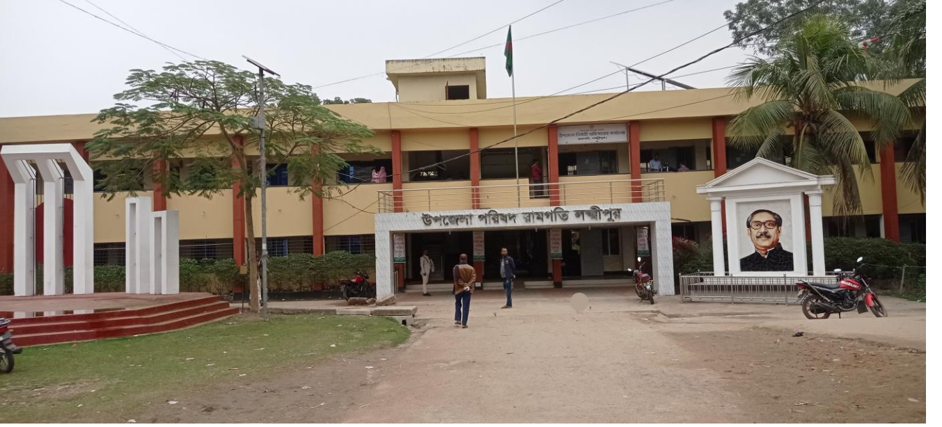
প্রশাসনিক ভবন, রামগতি, লক্ষ্মীপুর