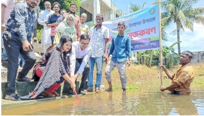
পোনা মাছ অবমুক্তকরণ

জাতীয় মৎস্য সপ্তাহ ২০২৩ উদযাপন উপলক্ষে উপজেলা পরিষদ পুকুরে রুই জাতীয় ২০(বিশ) কেজি পোনা মাছ অবমুক্ত করা হয়।