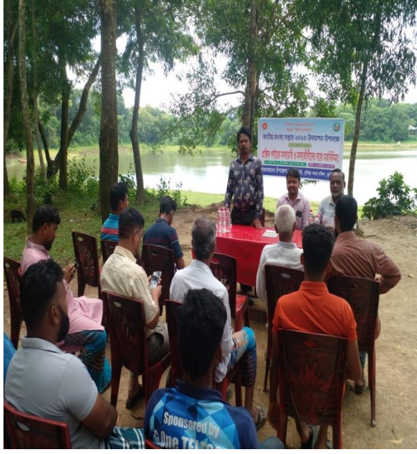
প্রান্তিক পহ@v†q মৎস্যচাষি ও মৎস্যজীবীদের সাথে মতবিনিময়

জাতীয় মৎস্য সপ্তাহ ২০২৩ উদযাপন উপলক্ষে প্রান্তিক পহ@vয়ে মৎস্যচাষি ও মৎস্যজীবীদের সাথে মতবিনিময় সভা: