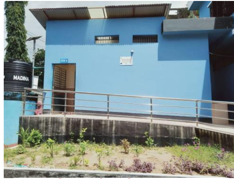
কালু ফকিরপাড়া বালিকা দাখিল মাদ্রাসা ওয়াশ ব্লক