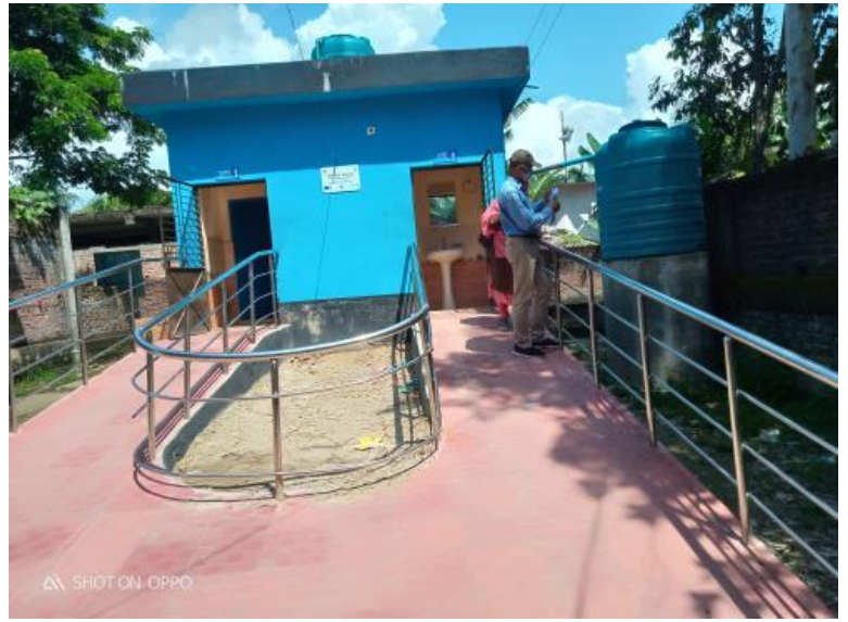
সাগরপাড়া কমিউনিটি ক্লিনিক ওয়াশ ব্লক