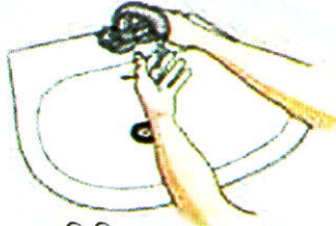
পানি দিয়ে হাত ভেজান

সাবান ও পানি দিয়ে ভালো করে হাত পরিষ্কার করুন (৪০-৬০ সেকেন্ড)