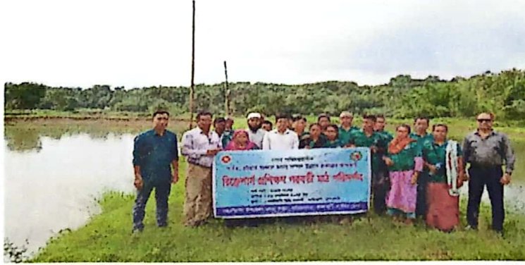
চিত্র: মাঠ পরিদর্শনের স্থিরচিত্র