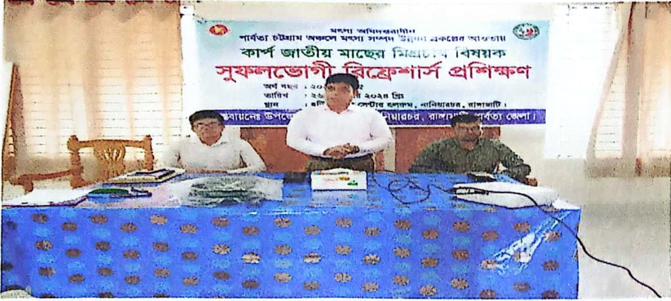
চিত্র: কার্যক্রমের স্থিরচিত্র