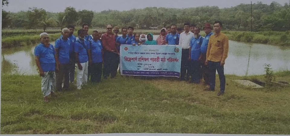
চিত্র: কার্যক্রমের স্থিরচিত্র