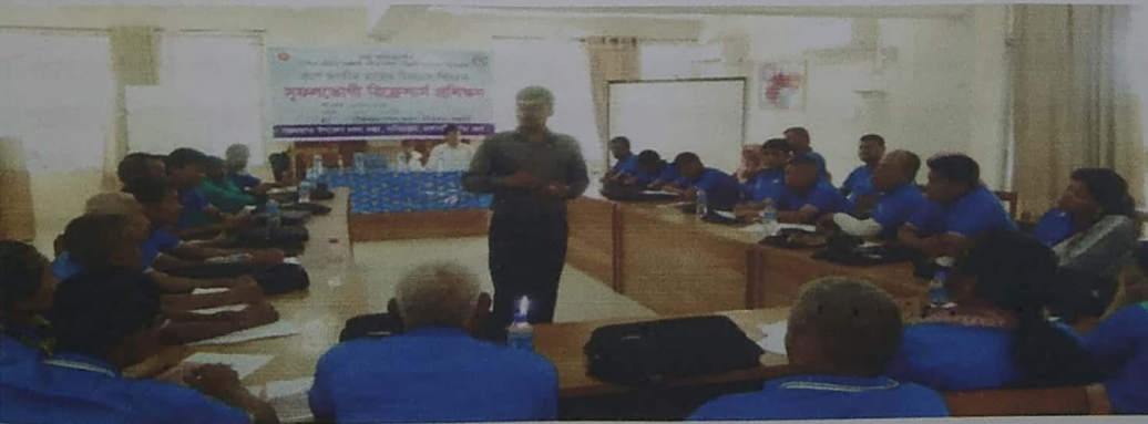
চিত্র: কার্যক্রমের স্থিরচিত্র