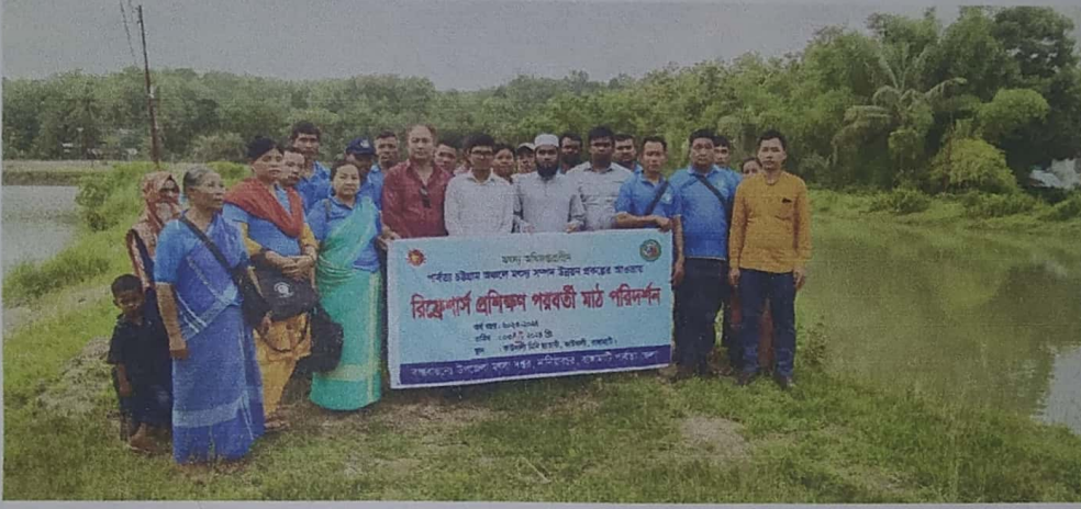
চিত্র: কার্যক্রমের স্থিরচিত্র